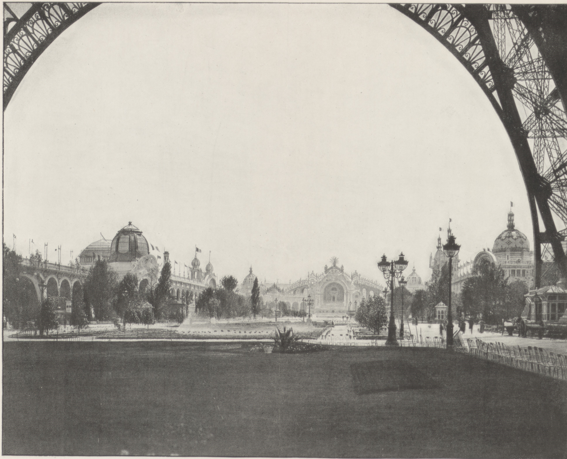
PERSPECTIVE ET JARDIN DU CHAMP-DE-MARS